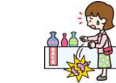
買い物中過って商品を壊した