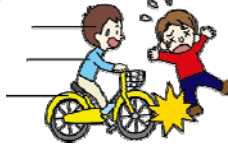
自転車にはねられてのケガ